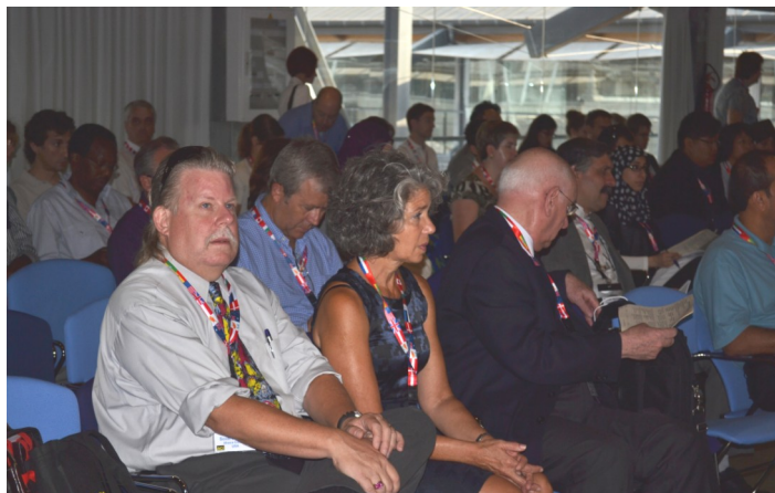
Asistentes prestan atención a la ponencia