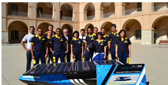
Presentación de la Solar Race del año pasado

La UPCT busca diez voluntarios para participar en las tareas previas a la competición, para la competición Solar Race Región de Murcia 2012, que tendrá lugar del 4 al 6 de octubre en el Circuito de Velocidad de Cartagena. Desde la Universidad recuerdan que es conveniente que los candidatos conozcan las características técnicas básicas de los vehículos participantes y que puedan hacer de guía de los grupos de visitas que asistirán a la carrera.