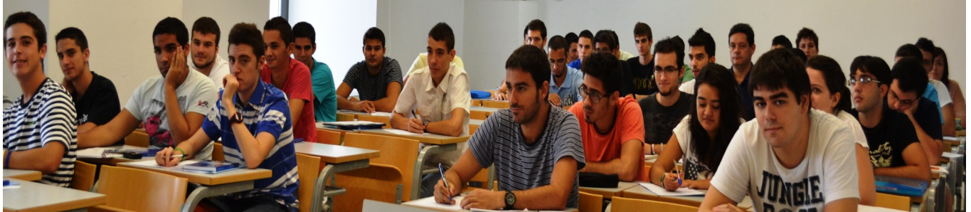
Alumnos en su primer día de clase

Las aulas volvieron a llenarse el pasado 24 de Septiembre en los campus de Alfonso XIII y la Muralla del Mar, así como en la Facultad de Ciencias de la Empresa (en el antiguo Cuartel de Instrucción de Marinería o CIM), donde unos quinientos docentes e investigadores de siete centros propios y dos adscritos imparten diecisiete titulaciones de gra-