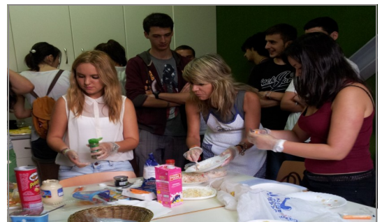
Alumnos en una de las sesiones prácticas

Las enseñanzas que han recibido los jóvenes abarcan los conceptos más básicos pero también los menos conocidos para organizarse su dieta: montar una mesa, preparación de menús baratos y nutritivos, organizar una fiesta o una actividad deportiva, o formas saludables de ocio.