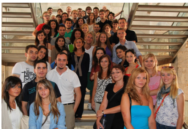
Estudiantes Erasmus junto con sus padrinos

Cartagena busca estudiantes voluntarios para el programa Padrino, con