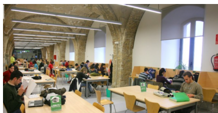
Alumnos en la Biblioteca de Antigones

Las bibliotecas de la Universidad Politécnica de Cartagena acogieron durante el pasado mes de agosto a 353 usuarios por día, solamente en horario de mañana, de 8.30 a 14.00 horas. El porcentaje por perfil de estos usuarios es de un 55% de estu-