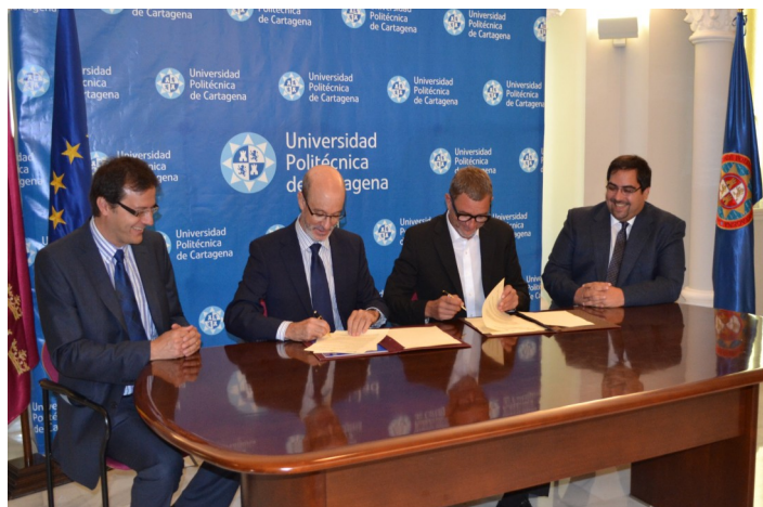
Representantes de ambas instituciones se muestran sonrientes en la firma del convenio

El acuerdo consiste en la cooperación conjunta en programas de formación, participación en proyectos conjuntos tanto a nivel nacional como internacional, asesoramiento mutuo y facilidades para el uso de sus instalaciones. La colaboración entre UPCT y SPG Río Mula incluye también la participación en los campos