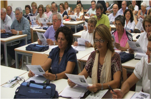
Alumnos en una de las clases

Mayores comenzaron las clases en la Facultad de Ciencias de la Empresa (antiguo Cuartel de Instrucción de Marinería).