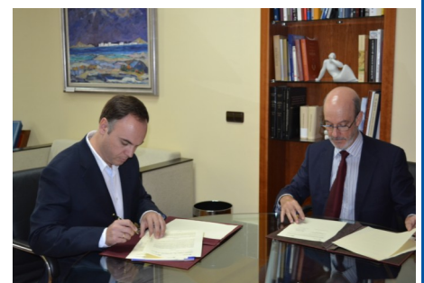
Durante la firma del convenio

ción y formación, además de las que se incluyen concretamente en el ámbito de la I+D+I. Motiva es una empresa creada para formentar la cultura emprendedora y desarrollar iniciativas que faciliten la puesta en marcha de proyectos empresariales por parte de los emprendedores. Una de estas iniciativas es la del desarrollo personal como parte fundamental para lograr el éxito en los proyectos emprendedores. .