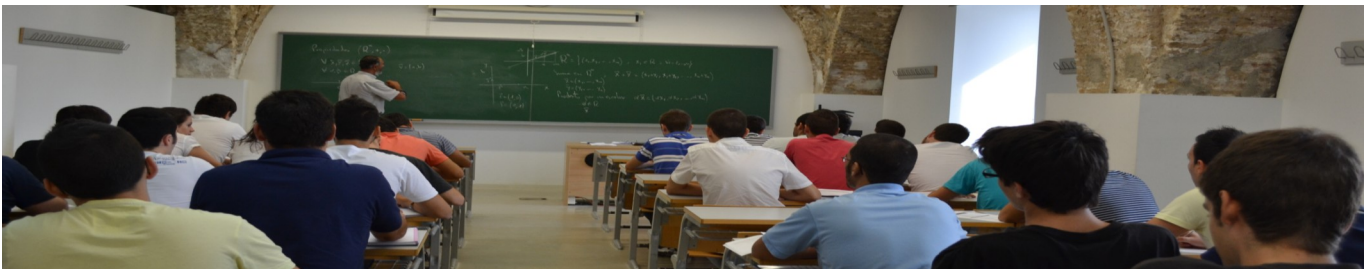
Alumnos atendiendo a las explicaciones del profesor

El inicio oficial del curso da continuidad a una actividad que no ha cesado en la UPCT durante el pasado mes de Septiembre, porque ha habido alumnos preparando exámenes en las distintas bibliotecas repartidas en los campus de la universidad y diversas salas de estudio o incluso revisando ya materiales para las primeras clases.