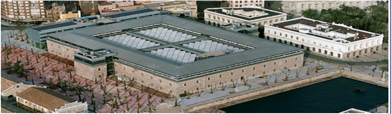
El CIM visto desde el aire