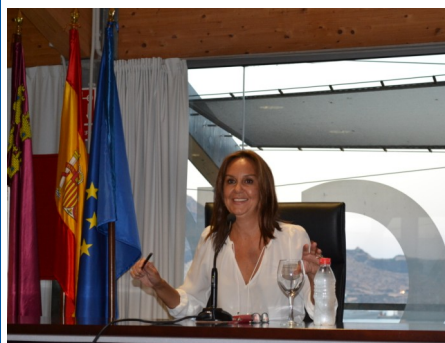
María Dueñas en la presentación del libro

La escritora y profesora María Dueñas presentó en el salón de actos de la Facultad de Ciencias de la