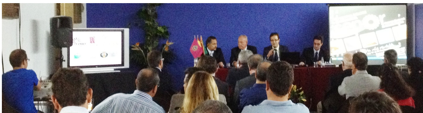
Asistentes a las jornadas prestan atención a los ponentes en una de las charlas

Más de un centenar de empresarios, técnicos y estudiantes se dieron cita en Lorca en la jornada "Innovación en el sector ganadero de carne" , organizada por el Foro Agroalimentario (Foagro) en el marco de SEPOR. La actividad fue seguida también por más de 4.000 internautas que trasladaron sus preguntas a través de las redes sociales mediante la cobertura informativa realizada desde Red Profesional del sector "agro" www.CHIL.org