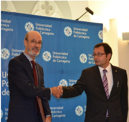
Firma del convenio