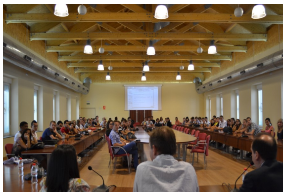
Representantes de la UPCT dan la bienvenida a los estudiantes Erasmus

Treinta y nueve de ellos van a estudiar, en la Facultad de Ciencias de la Empresa (FCE), treinta y dos en la Escuela Técnica Superior de Ingeniería Industrial (ETSII), trece en la Escuela Técnica Superior de Ingeniería Agronómica, once en la Escuela Técnica de Arquitectura de la Edificación (ARQUIDE) cuatro en la Escuela Técnica Superior de Telecomunicación (ETSIT) y cinco en la Escuela de Ingeniería Civil y Minas (EICM). Los Erasmus Mundus Mare Nostrum llegan de universidades de Túnez, Marruecos y Argelia. La experiencia de los Erasmus no es solo formativa, ni personal.